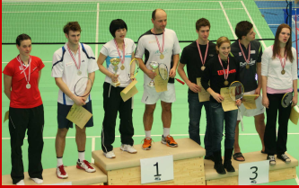
Staatsmeisterschaften Allgemeine Klasse Seite 2