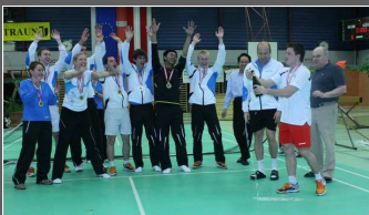
Bundesliga 11. Titel für Traun Seite 5