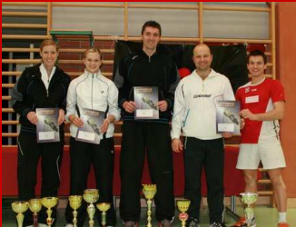
Landesmeisterschaften Allgemeine Klasse Seite 3