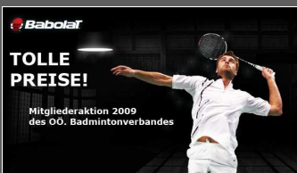
Mitgliederaktion 2009 Babolat Seite 6