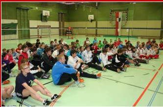
Nachwuchs- Landesmeisterschaften Seite 4